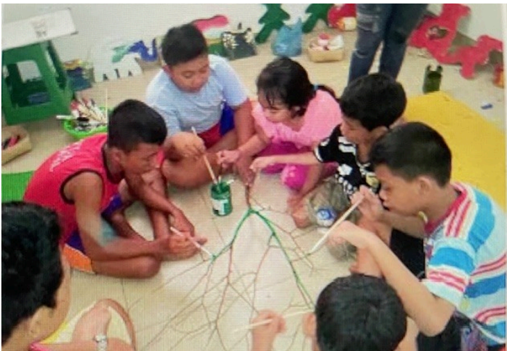
De donatie van The Thom Foundation is besteed aan salaris voor de leerkrachten en lesmateriaal van het project in Lovina en de start-up in Surabaya.

De kinderen leren naast creatieve vaardigheden, ook rekenen, taal, sociale vaardigheden en vaardigheden als klokkijken, kleding aan- en uittrekken en opvouwen en ze doen aan sport en spel.