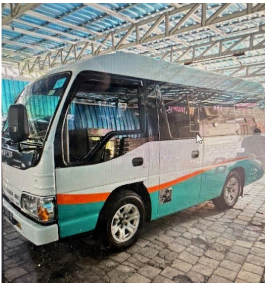
De bus is in november 2023 aangeschaft.

De kosten voor een tweedehands minibus bedroegen € 20.000; daarvan heeft The Thom Foundation de helft voor haar rekening genomen.